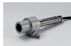
Collare per pulizia APM