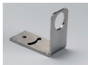
FBL Squadretta di fissaggio