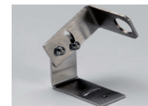
ABL Squadretta reg. 2 assi